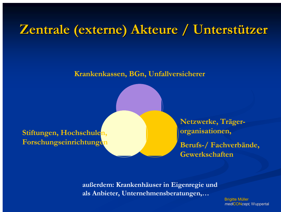
Abb. 1: Zentrale Akteure für BGF und BGM im Krankenhaus

Die folgende Abbildung gibt einen Überblick über überbetriebliche Akteure, die sich in der BGF und im BGM im Krankenhaus identifizieren lassen. Einige davon werden im Folgenden exemplarisch vorgestellt; dabei können die oben ange deuteten Wechselwirkungen nur punktuell berücksichtigt werden.