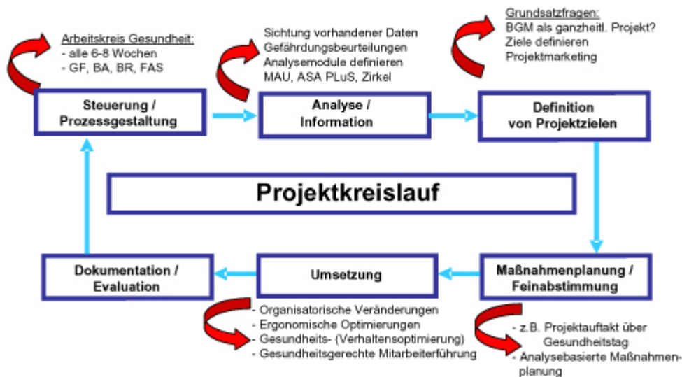
Abb. 3: BGM – der Prozess